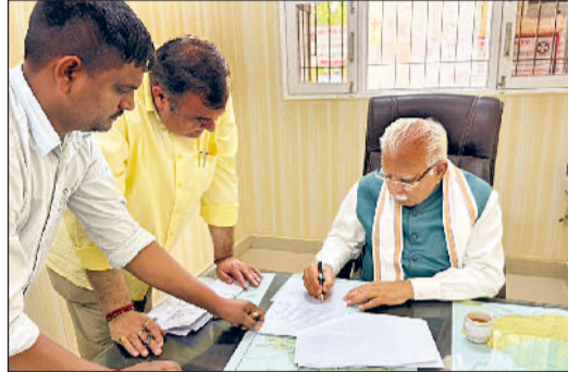
रोहतक। कागजात पर हस्ताक्षर करते केंद्रीय ऊर्जा एवं शहरी आवास मंत्री मनोहर लाल।