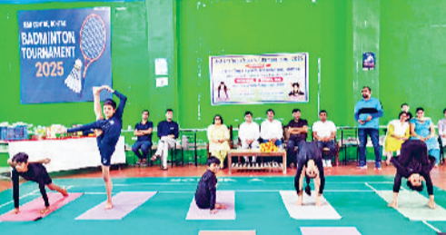
रोहतक। योग प्रतियोगिता में भाग लेते प्रतिभागी।