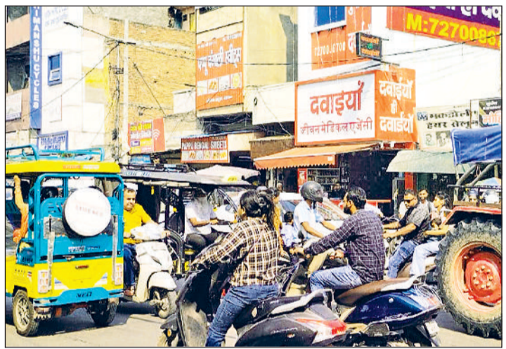
रोहतक। गोहाना स्टैंड पर जाम के फंसे वाहन।

दीपावली बीते चार दिन हो चुके हैं, लेकिन शहर की सड़कों पर जाम की समस्या जस की तस बनी हुई है। दीपावली जैसे बड़े त्योहार पर तो लोगों को जाम की परेशानी होना आम बात है, लेकिन अब जबकि त्योहार खत्म हो चुका है, फिर भी शहर में ट्रैफिक की स्थिति सामान्य नहीं हो पा रही है। वाहन चालक रोजाना घंटों तक सड़क पर फंसे रहते हैं, जिससे लोगों को भारी परेशानी झेलनी पड़ रही है। किला रोड, डी पार्क, मेडिकल मोड, शीला बाईपास, छोट्टराम चौक, कोर्ट चौक और रेलवे रोड जैसे प्रमुख मार्गों पर दिनभर ट्रैफिक जाम का आलम रहता है। आश्चर्य की बात यह है कि दीपावली के बाद अब सड़क किनारों पर अस्थाई दुकानें या फेरीवालों की भीड़ भी नहीं है, फिर भी जाम की स्थिति बनी हुई है।