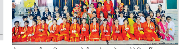
रोहतक। एमडीएन पब्लिक स्कूल में दीप महोत्सव में भाग लेते विद्यार्थी।

विद्यालय साज-सज्जा, उत्साह और छात्रों की रचनात्मकता से आलोकित हो उठा