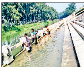
रोहतक। छठ महापर्व को लेकर तैयारी करते।